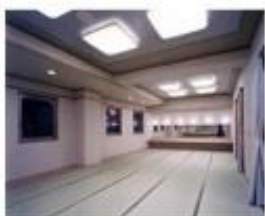
楽屋1 (和室) 25畳