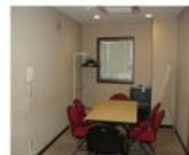
楽屋3 (洋室) 12㎡