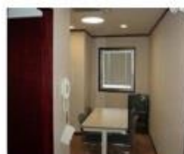
楽屋2 (洋室) 10㎡